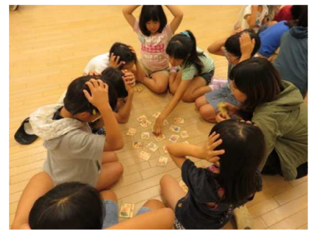
第2回 とぎつカナリーホールに於いて

写真左から「エコガイダー」を見る児童、ごみの分別、「エコかるた」で環境を護るヒントを学ぶ。