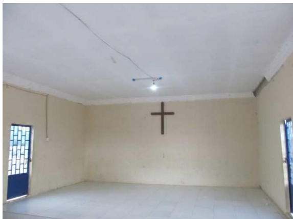
教会に電気が灯りました。勉強は夕方6時ごろから始まります。ソーラー発電の灯りがありがたいです。