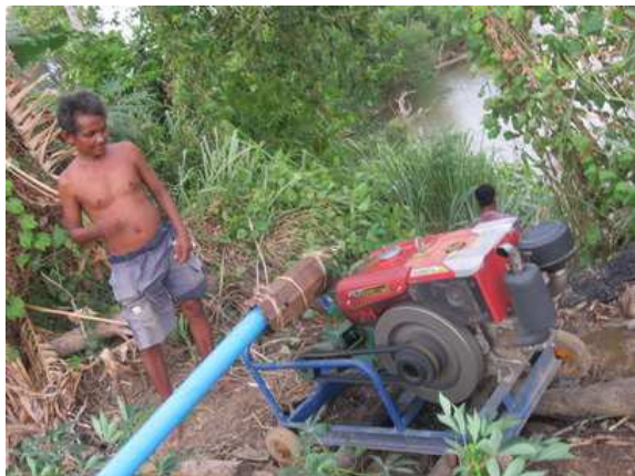
ロカブス村ではここ1ヵ月間、雨が降っていません。完成した水路にポンプで水を揚げることにしました。雨が降るのも時間の問題だと思いますが、その水をコントロールするのに、この灌漑用水路とポンプが役に立ちます。