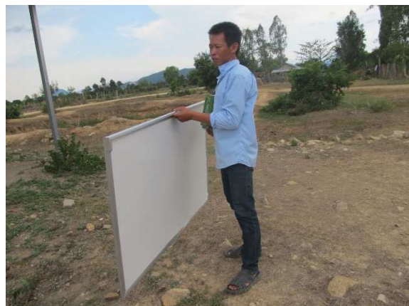
ホワイトボードも設置して、現地スタッフが毎日授業しています。識字率が上がり生活も変わります。