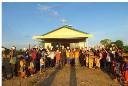
ロカブス村の教会(集会場として使用)

カンボジアは雨季に入りましたが、バッテリーはそこまで降水量が多くな、かなり暑い(40度近く)日が続いております。