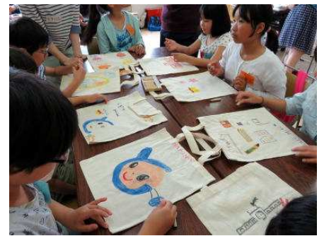
第1回 時津公民館に於いて

写真左から英語の学習、時津町の名所旧跡や特産物のまとめ発表、エコバッグの絵付け(教室に通うときに物入れとして使う)。